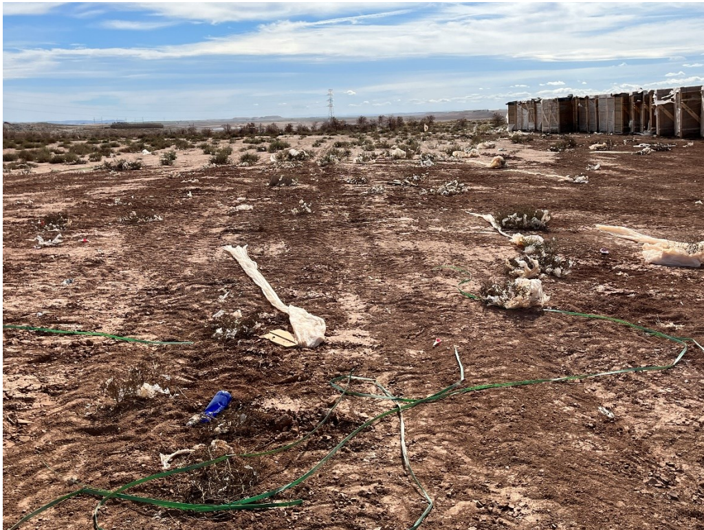
Figura 8 Restos de plástico