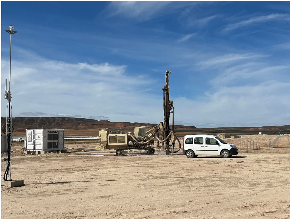
Figura 6 Labores de hincado