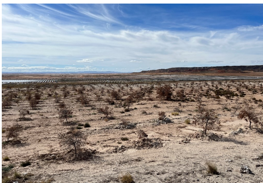
Figura 5 Masa de pinar trasplantada