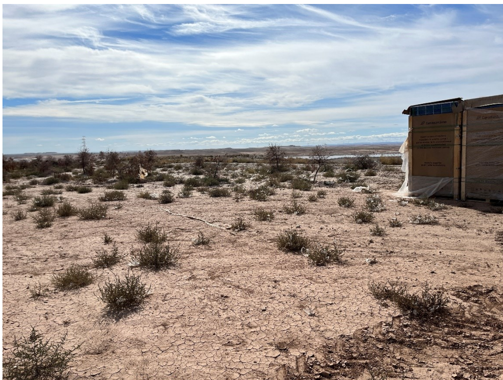
Figura 9 Restos de plásticos