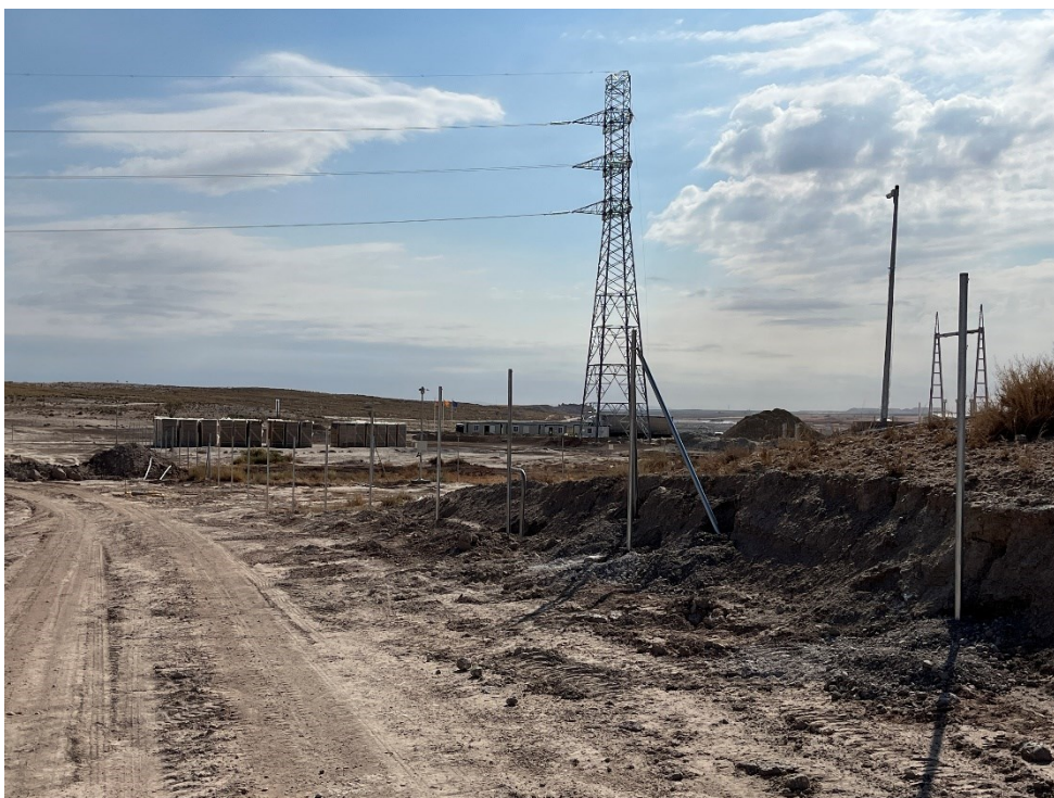
Figura 7 Colocación del vallado perimetral