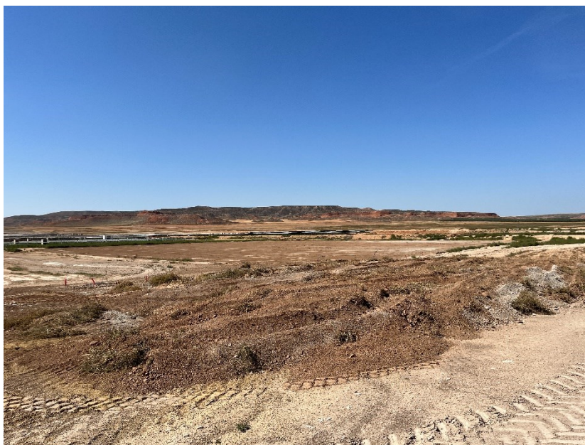
Figura 2 Acopio de tierra vegetal