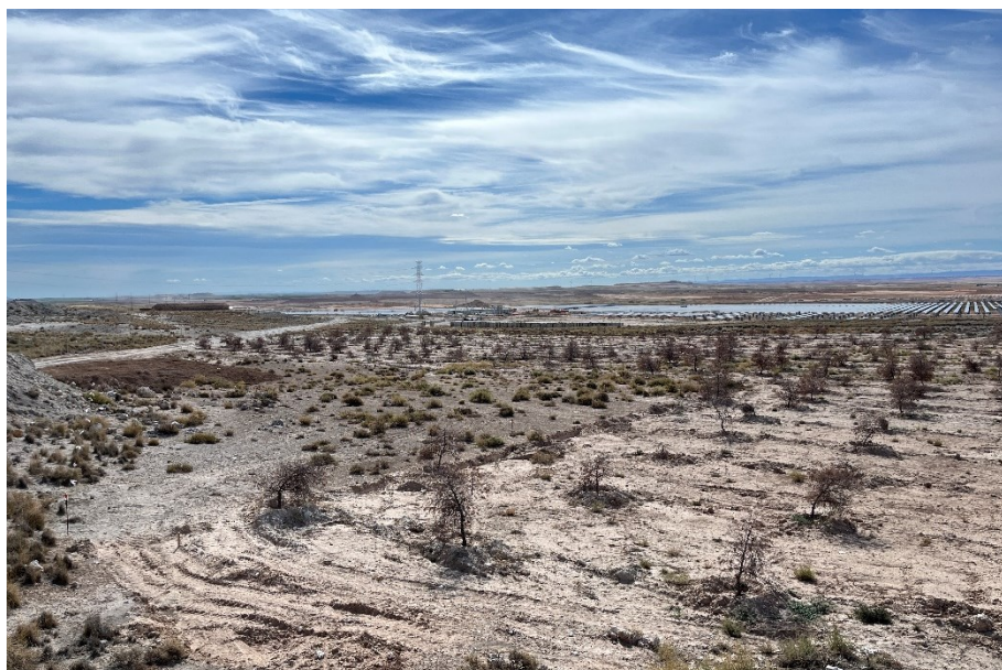
Figura 4 Masa de pinar trasplantada

El presente anexo se compone de un número representativo de fotografías del total realizado durante el periodo evaluado, escogidas por su relevancia y/o carácter explicativo para la correcta comprensión del presente informe.